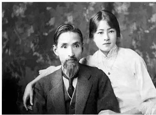
林長民與女兒林徽因。（福州市博物館）

這是建築學的課本。當時留學日本學習建築的劉敦楨讀到此書，也被深深刺痛：西方中心主義的視角令人難以接受。